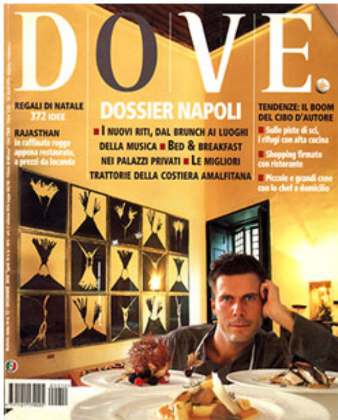
Dove, n. 12 dicembre 2000